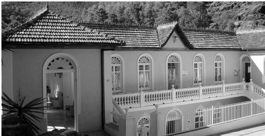
Imagen 1. El balneario de Tolox, en la provincia de Málaga, tiene una dilatada historia y un magnífico entorno en el que destaca por su relevancia la Sierra de las Nieves, declarada Reserva Mundial de la Biosfera

De hecho, los más de doscientos manantiales declarados que había en Andalucía hacían de esta comunidad la región española con más caudal de aguas termales, a pesar de que el número de balnearios abiertos al público aún fuera pequeño considerando sus potencialidades de explotación. Esa riqueza de caudal responde, sin duda, a la gran variedad geológica y climatológica de Andalucía (imagen 1).