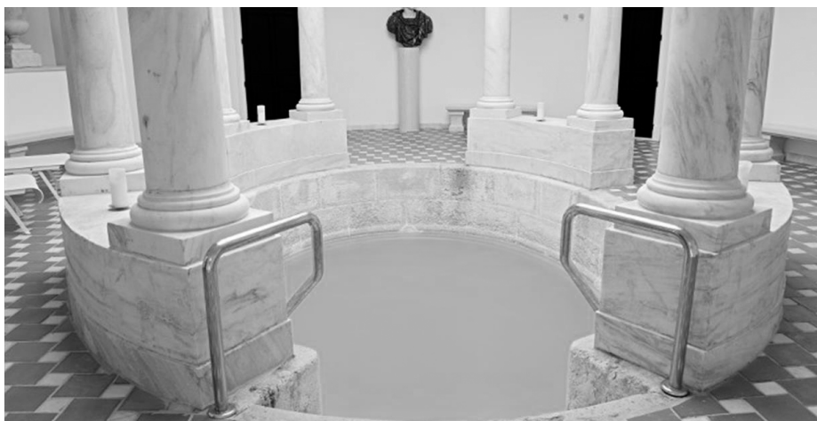
Imagen 5. De origen romano, el balneario malagueño de Carratraca se ubica en un entorno serrano que no ha limitado nunca la visita de importantes viajeros. A ello contribuía no solo la calidad de sus aguas sino el espléndido edificio de mediados del siglo XIX hoy rehabilitado.

Andalucía dispone de una amplia variedad de villas termales de enorme riqueza natural cuya utilización asegura salud, alivio de dolencias, disfrute de paisajes y de territorios de naturaleza privilegiada. Viajando a nuestros balnearios contribuiremos también a dinamizar las áreas rurales en las que se encuentran, a evitar la despoblación, y todo ello a cambio únicamente de nuestro bienestar (imagen 5).