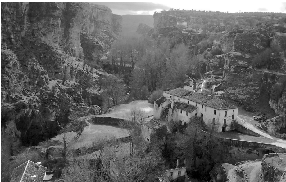
Imagen 4. Los tajos y barrancos de Alhama de Granada han gozado entre los agüistas que acudían a su balneario de una bien merecida fama por su gran valor paisajístico.