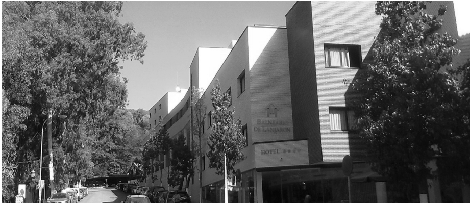
Imagen 3. El balneario de Lanjarón, en la provincia de Granada, se ubica en las proximidades del Parque Natural de Sierra Nevada, siendo uno de los balnearios más importantes del país por los múltiples manantiales que posee.

las generaciones pasadas que hayan preservado ese riquísimo legado y lamentar que por dejadez o por explotación excesiva muchos manantiales hayan desaparecido de nuestra memoria —que no de la de sus antiguos usuarios—, llevándose consigo todo ese patrimonio (natural, etnográfico, histórico, cultural y artístico) que atesoraban relacionado con la cultura de los baños... Andalucía es uno