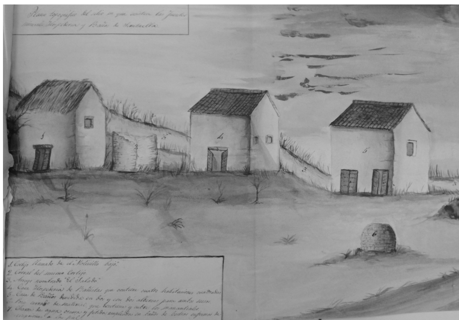
Imagen 2. Las casas de baños captaban usuarios con menor capacidad adquisitiva que los que acudían a los balnearios, pero vivían más próximos a ellas. Las instalaciones eran muy sencillas, incluyendo excepcionalmente algún tipo de alojamiento, y las aguas no habían obtenido declaración oficial de mineromedicinales (Casa de baños de Santaella, Córdoba, a mediados del siglo XIX, en un dibujo conservado en la Universidad Complutense de Madrid).

Fue en abril de 1856 cuando un médico, llamado Marcial de Reyna y Puyón, solicitó de las autoridades sanitarias la declaración de estas aguas salino-sulfurosas como de utilidad pública a fin de que pudiera haber en sus instalaciones un médico director. Pese al seguimiento que había hecho este doctor desde 1847 a 1854 de sus efectos medicinales y de las analíticas realizadas por la misma época tanto del agua como de sus lodos, la concesión no llegó, quedando limitada su capacidad de atracción de clientes respecto a otros balnearios como el de Ardales o Carratraca, ambos en la provincia de Málaga, con aguas de características parecidas. En este sentido, al menos en el siglo XIX no parece que los agüistas de Santaella fueran de localidades muy alejadas de este núcleo urbano.