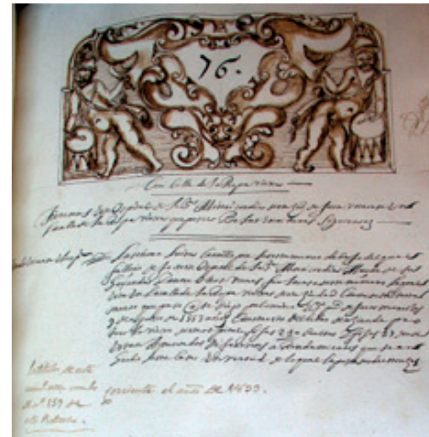
Título de propiedad de casa en la calle de la Ropa Viexa, de Jaén

pudieran vender, donar, o permutar sus posesiones sin su licencia, argumentando que eran bienes espirituales los que formaban este patrimonio sujeto al fuero eclesiástico, ya que estaba constituido por legados y mandas testamentarias de los fieles difuntos, que los dejaban para que les dijeran misas de aniversario y obras pías, condición que a su vez pone el Ayuntamiento cuando cede la administración de estos bienes a la Institución religiosa de los Hermanos del beato Juan de Dios.