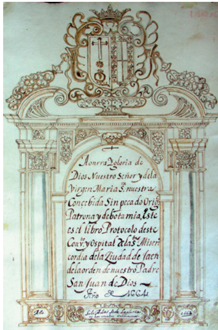
Portada del libro de Protocolos deste Convento y Hospital de la Santa Misericordia de la Ciudad de Jaén de Nuestro Padre San Juan de Dios