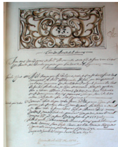
Título de Propiedad de la casa de la calle del Duende

portería solo dos casas. La primera viene desde dho Hospital y la ultima en este Año de 1664 de Miguel Ruiz de Cañabate labrador con que los viene a estar avallado su fundación según consta de las escrituras y títulos del agua que tiene y del tinte en que se fundo y donación del y de la que hizo esta dha zivd de nuestro Padre San Juan de Dios que se zitaran después fueron diferentes dotaciones de limosnas y otros vines Rayzes que dejaron para dho efecto muchos y muy onrrados Cavalleros y otras personas que se an enterrado en la dha Iglesia la qual fue labrada por mandado y a su costa del Ilustrísimo y Rdo Señor Luis Osorio de Santa Memoria Obispo que fue deste obispado por los años de mill y quatrozientos noventa y cuyas armas se conservan hasta oy sobre la portada de la Puerta y la iglesia”.