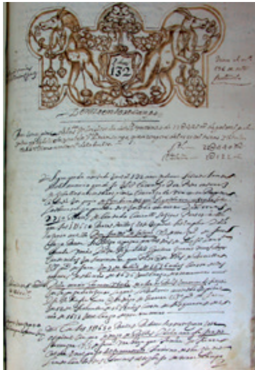
Censo de Torredelcampo