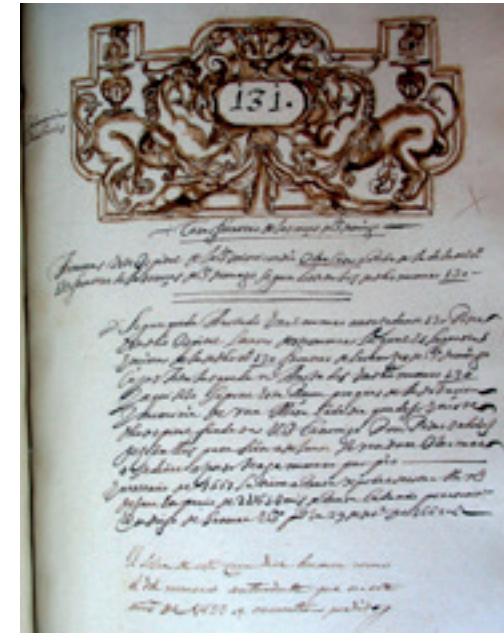
Título de propiedad de la casa en calle de las Cruces de Santo Domingo, de Jaén